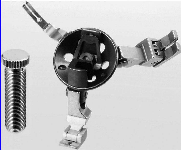
Brother type 154628-001 087.154.628 zonder stang sans barre without bar