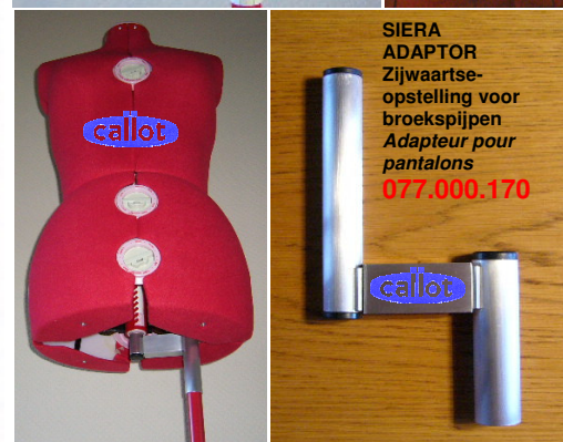
SIERA ADAPTOR Zijwaartse-opstelling voor broekspijpen Adaptateur pour pantalons 077.000.170