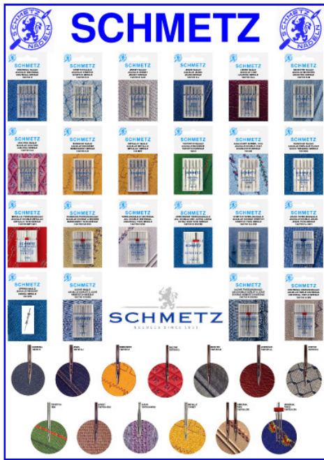
SCHMETZ - POSTER 010.000.047

HAX1 SP PL5 Plastiek los/navulling voor box van 5 Plastic seul/recharge pour box de 5 1 verp/emb. = 150 st./pcs. 75 019.170.075 90 019.170.090